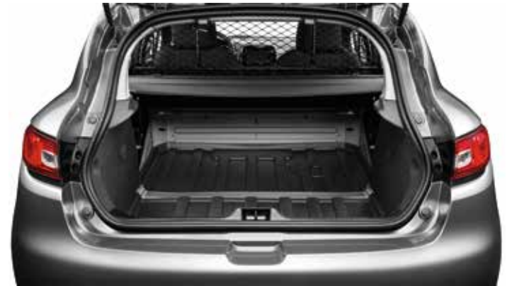
Espacio zona de carga